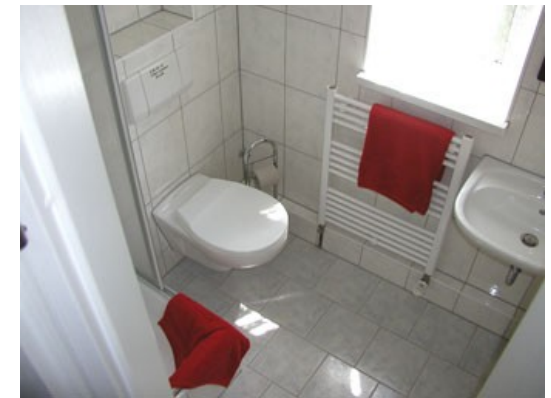
Bad von Zimmer 4